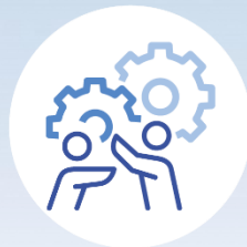
Category 4. Impact and mission with and for society

4 horizontális prioritás (ld. megjegyzés)