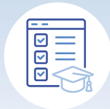
Category 3. Students' learning assessment