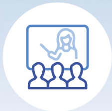
Category 2. Innovative teaching and learning