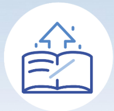
Category 1. Student-centred course design

GOOD PRACTICES ARE WELCOME IN 4 CATEGORIES