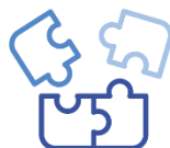
Inclusion and diversion