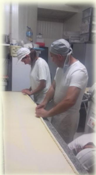
Példakép – családi hangulat