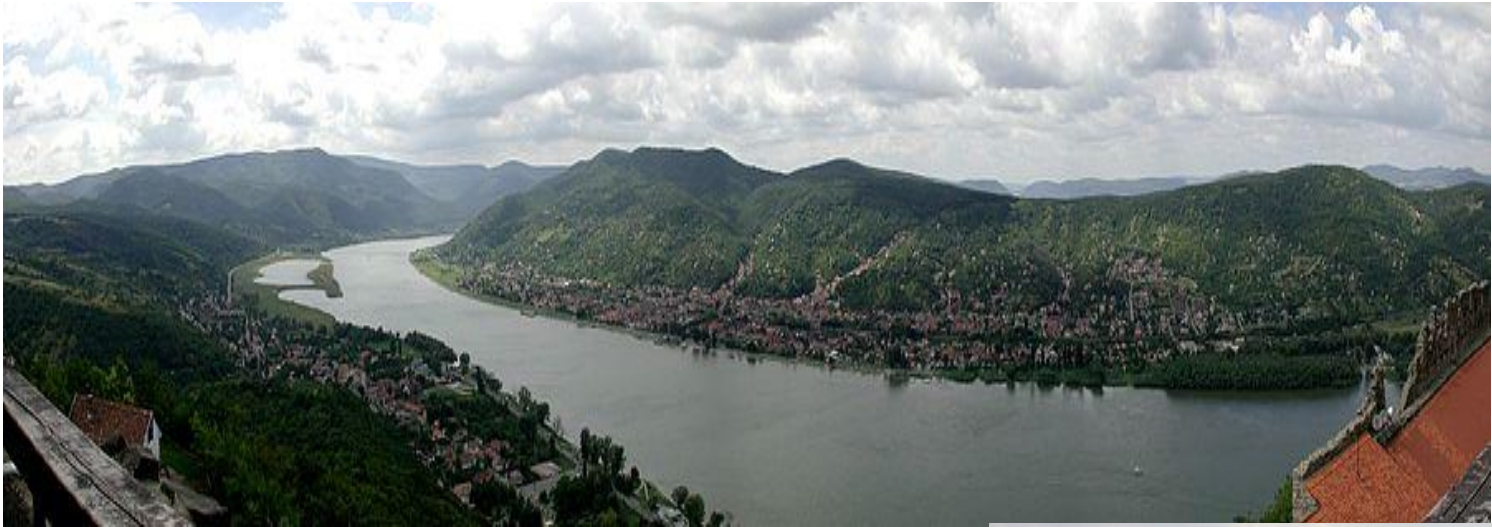
Visegrád, Danube Bend