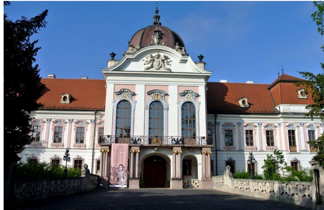
Royal Castle, Gödöllő