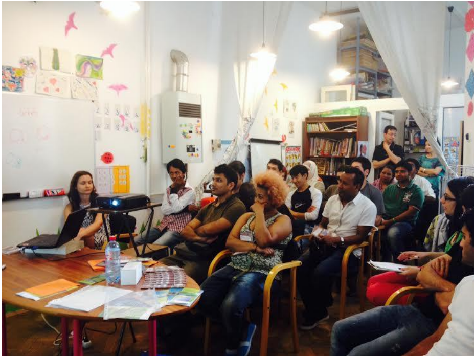
Menekültmisszió, Váci utcai közösségi ház