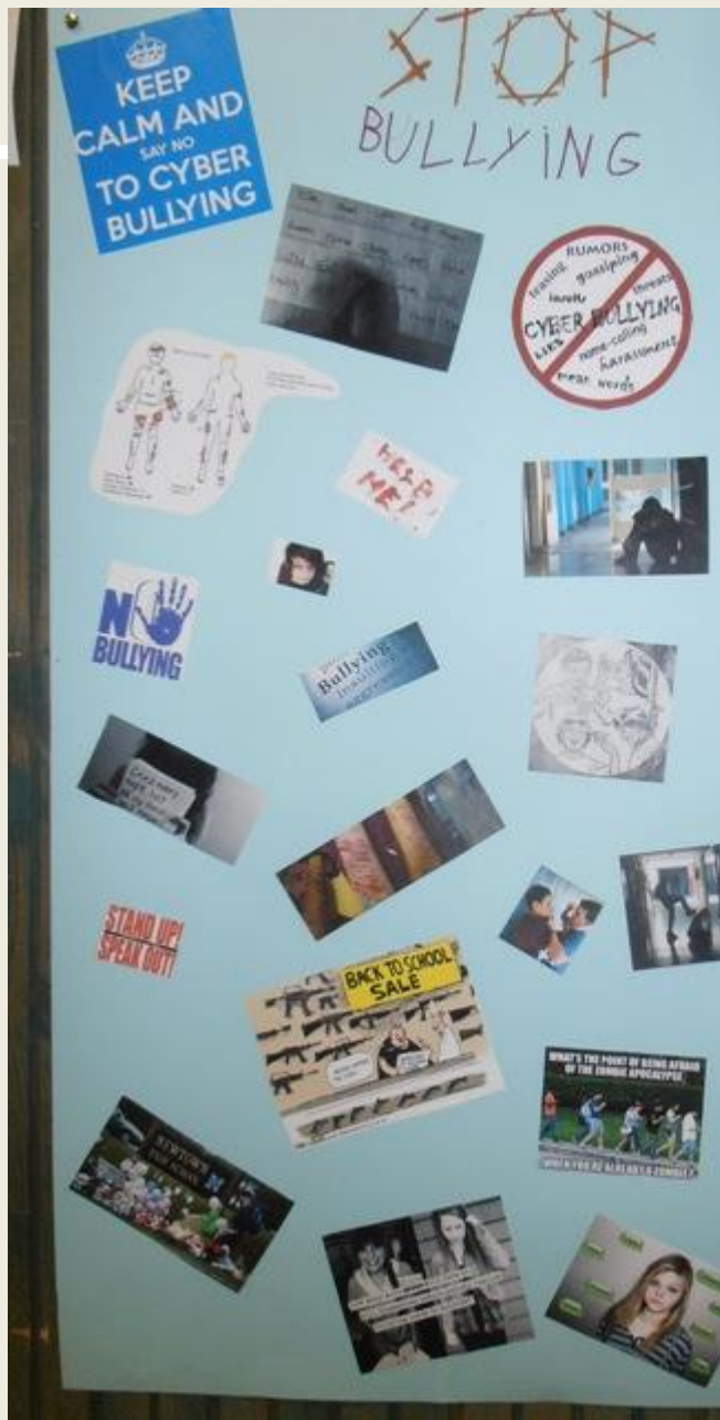
Európa 2000 Középiskola