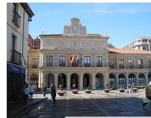
Joint staff training in Leon