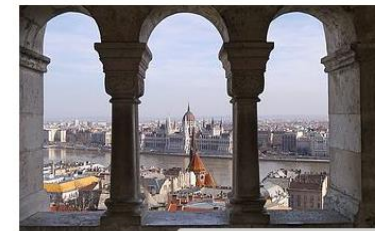
Specialist Seminar in Budapest