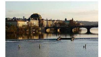
International conference in Prague